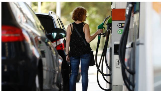
Una conductora retira una manguera de un surtidor para repostar combustible.